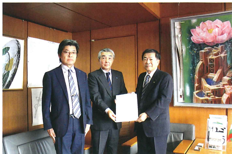
志布隆夫 村山市長：(右) 12月1日(金)

公平で健全な税制の実現を目指して会員企業の意見や要望を反映しながら、税のあるべき姿や将来像を見据えて建設的な意見を提言しその実現を訴えております。法人会の提言活動は、法人税の引き下げなどをはじめ、同族会社の留保金の課税制度の抜本的見直し、事業承継に関する税制の創設など、中小企業の活性化に資する税制の構築に寄与しています。