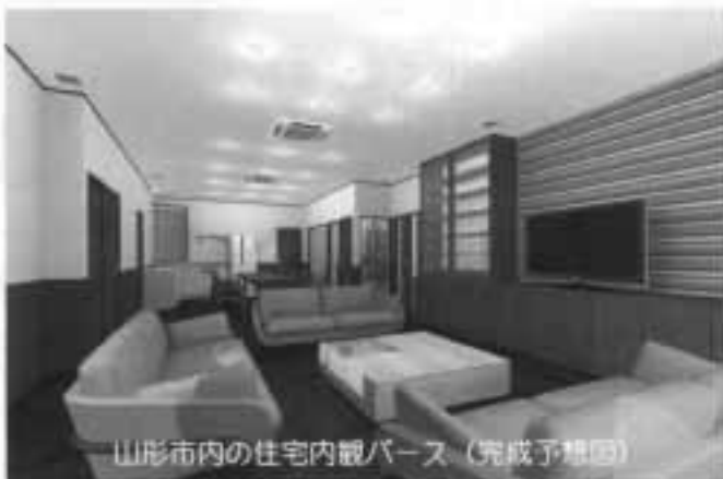
山形市内の住宅内観パース (完成予想図)

■本 社 〒999-4225 山形県尾花沢市若葉町3丁目8-26 TEL 0237-23-4131 FAX 0237-23-4132 ■山形営業所 〒990-0051 山形県山形市銅町2丁目1-5 TEL 023-679-5911 FAX 023-679-5912 http://www.dt2.co.jp