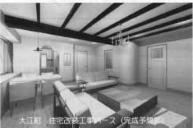
大江町、住宅改装工事パース (完成予想図)